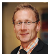
Martin Oberhauser Marketing & Kommunikation Baloise Investment Services www.baloise.ch