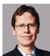
Hansjörg Ryser Mediensprecher Helvetia Versicherungen www.helvetia.ch